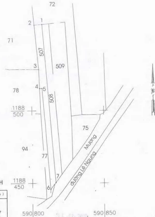
BẢNG LIỆT KÊ TỌA ĐỘ GÓC RANH